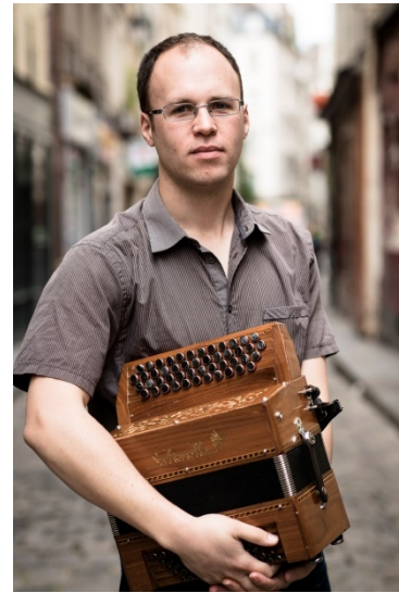
Begleitung: Ludovic Rio